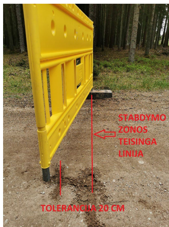
Stabdymo zonos neįveikimas už tolerancijos ribų.