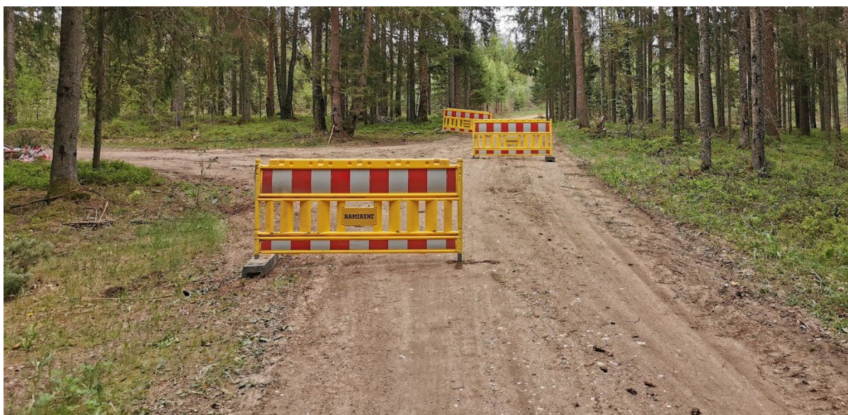
Bendras stabdymo zonos išstatymas, kai naudojamos mobilios plastamasinės tvorelės