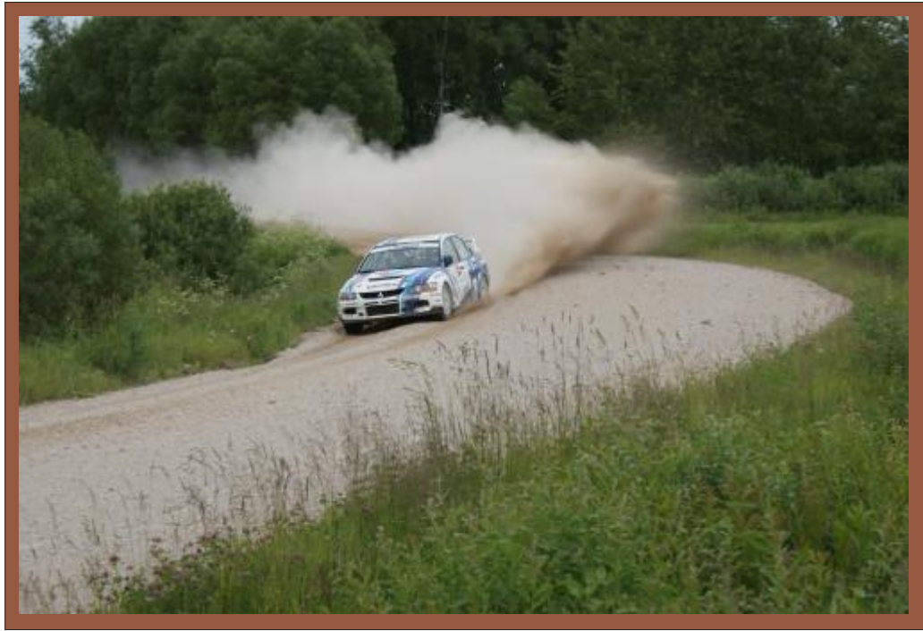
Vytauto Švedo ir Žilvino Sakalausko ekipažas ralius Žemaitijoje laimėjo 2009, 2010, 2011 ir 2013 metais