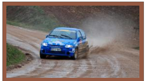
Po pertraukos į Žemaitijos ralio trasas grįš vietinis ekipažas Vilmantas Pupius ir Gediminas Račas