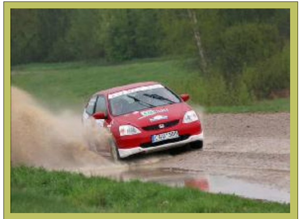
2008 metų Baltarusijos ralio čempionas Tomas Savickas, šio ralio organizatorius