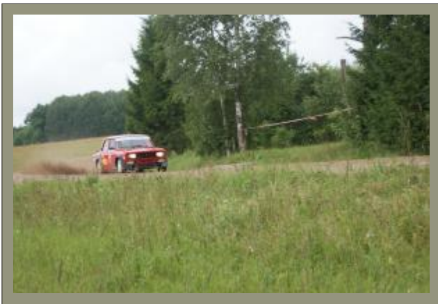
Visada žiūrovų laukiamas ir mėgiamas Dovilas Čiutelė